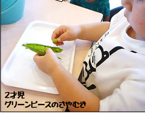
2才児 グリーンピースのさやむき