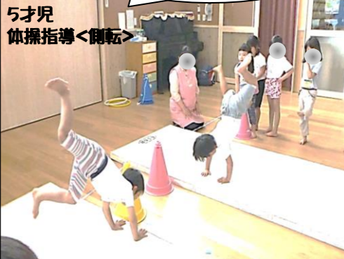
5才児 体操指導<側転>