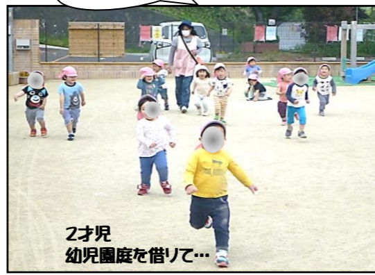
2才児 幼児園庭を借りて…