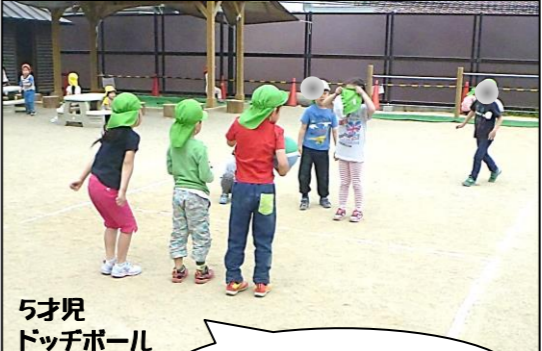
5才児 ドッチボール