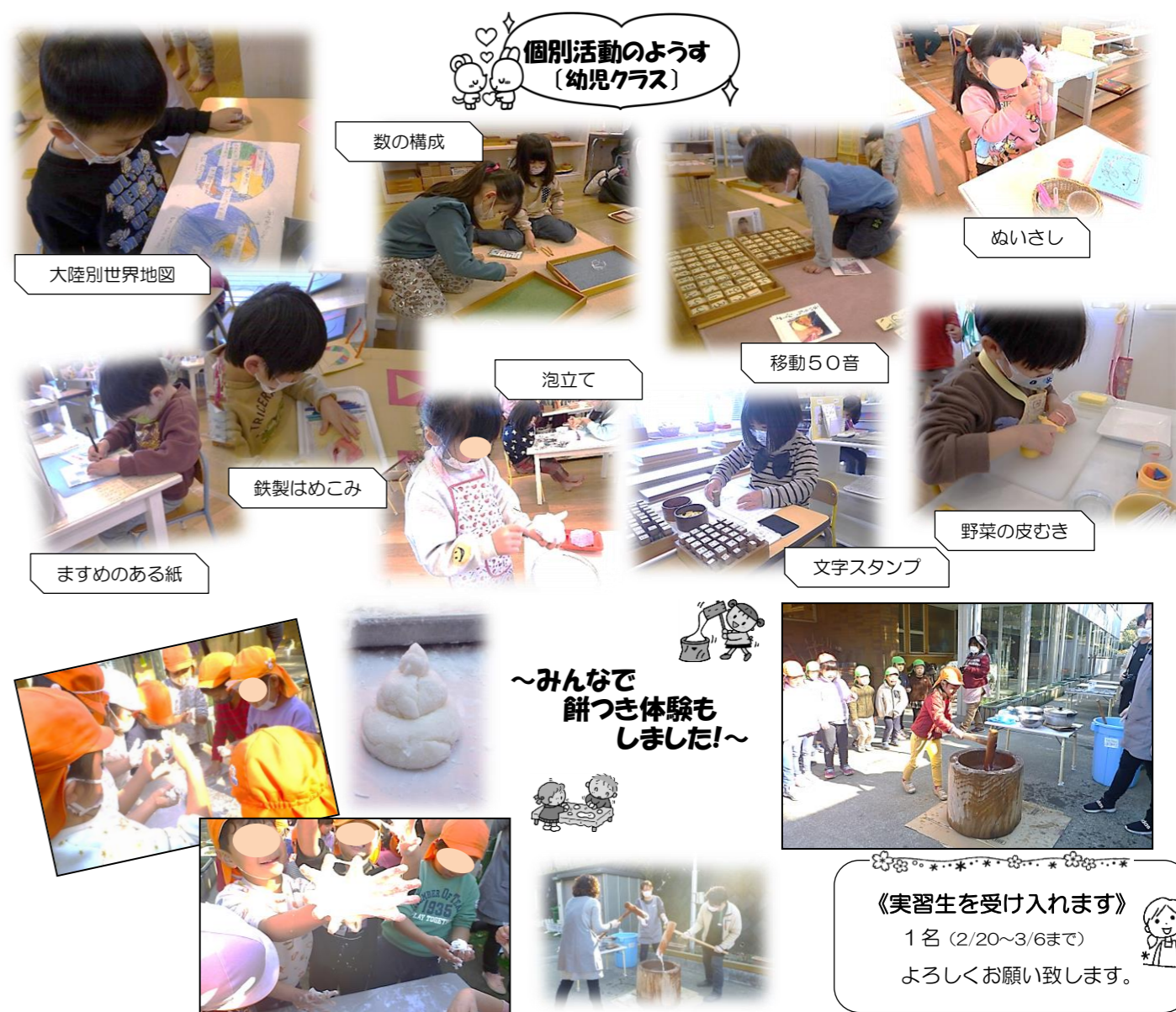
個別活動のようす (幼児クラス)