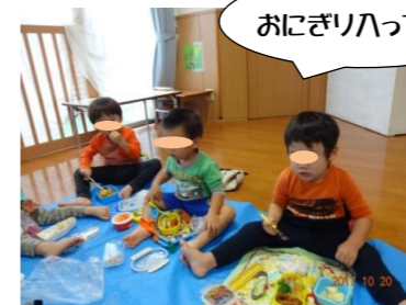
おにぎり入ってたよ