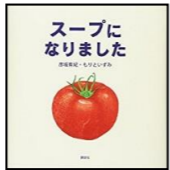
ひよこぐみ りすぐみ