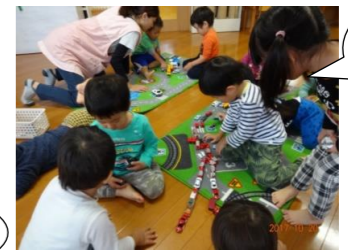
今度は トンネル作り