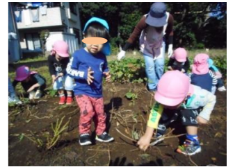
お兄さん何か やってるよ